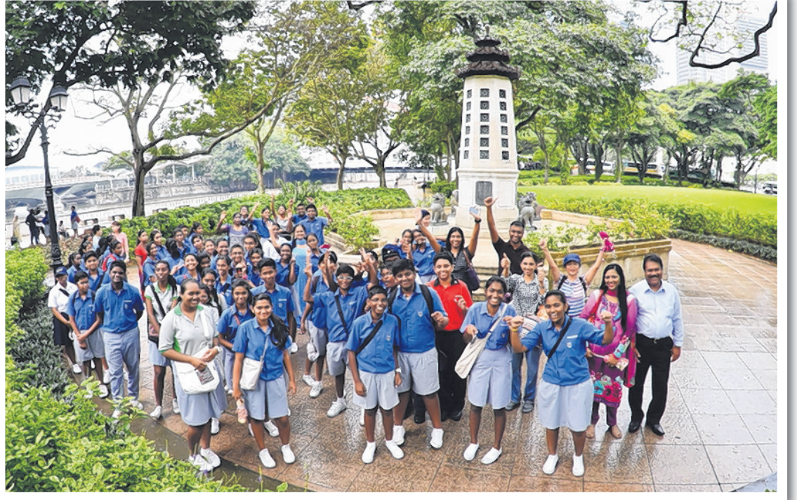
லிம் போ செங் நினைவிடத்தில் தெக் வாய் உயர்நிலைப்பள்ளி மாணவர்கள்

சிங்கப்பூரின் ஆரம்ப கால வளர்ச்சிக்குப் பாடுபட்டதற்காகவும் சீன சமூகத்தின் வளர்ச்சிக்கு உறுதுணையாக இருந்ததற்காகவும் லிம் போ செங் நினைவிடம் 1954இல் கட்டப்பட்டது. நினைவிடத்தின் கூரை வெண்கலத்தால் உருவாக்கப்பட்டது. மேலும், நினைவிடத்தைச் சுற்றி நான்கு சிங்கங்கள் அமைக்கப்பட்டுள்ளன. நினைவிடத்திற்கு வருவோர் லிம் போ செங் அவர்களின் வாழ்க்கை வரலாற்றை அறிந்துகொள்ள, சீனம், ஜாவி, தமிழ், ஆங்கிலம் ஆகிய மொழிகளில் குறிப்புகள் பொறிக்கப்பட்டுள்ளன. இந்த நினைவிடம் எஸ்பிஎன்ட் பூங்காவில் அமைந்துள்ளது.