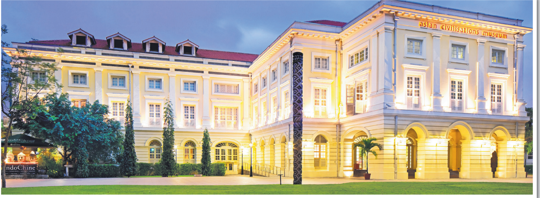
தற்போதைய ஆசிய அரும்பொருளகம்