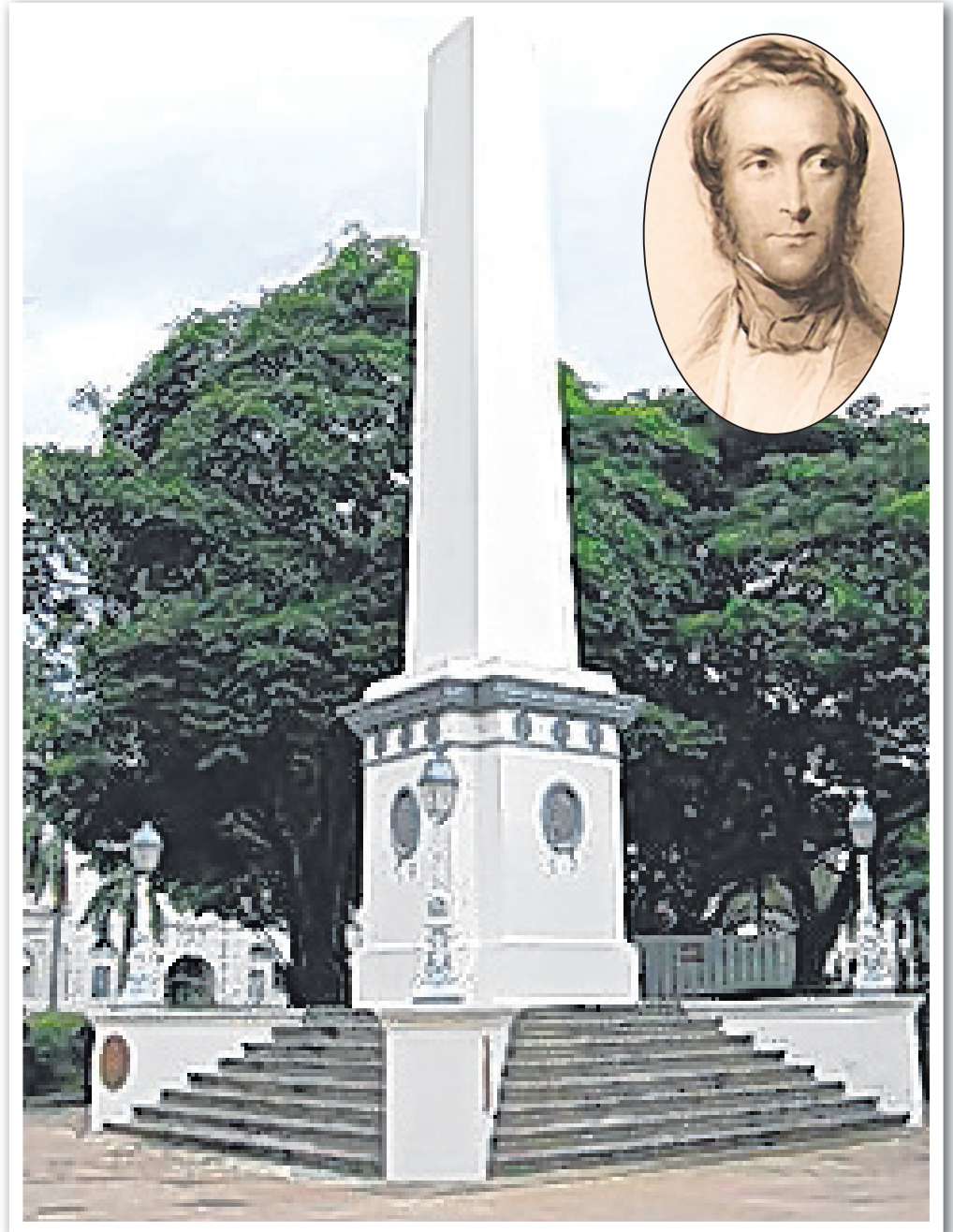
தற்போதைய டெல்ஹெளசியின் நினைவிடம். மேலே வட்டப் படம்: ஜேம்ஸ் ஆண்ட்ரூ.

“OBELISK” என்ற சொல் பெரும்பாலும் நான்கு பக்கங்கள் கொண்ட, நீண்ட உயரமான கற்களால் ஆன ஓர் அமைப்பைக் குறிக்கும்.