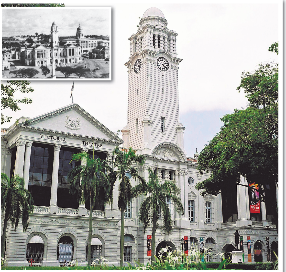
தற்பொழுது உள்ள விக்டோரியா அரங்கம். உள் படம்: 1945ல் விக்டோரியா அரங்கம்

1919ஆம் ஆண்டு, சிங்கப்பூர் கண்டுபிடிக்கப்பட்டதன் 100ஆம் ஆண்டு நிறைவைக் கொண்டாடும் வகையில், அதுவரை பாடாங்கில் நிறுவப்பட்டிருந்த சர் ஸ்டாம்ஃபர்ட் ராஃபிள்சின் சிலை அகற்றப்பட்டு, விக்டோரியா நினைவு மண்டபத்திற்கு முன் நிறுவப்பட்டது.