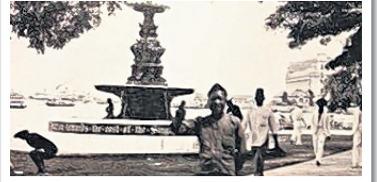
1954ல் கட்டப்பட்ட லிம் போ செங் நினைவிடம்