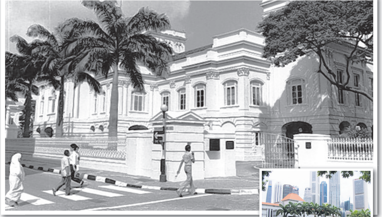
பழைய நாடாளுமன்றக் கட்டடம். அருகில் வண்ணத்தில் புதிய நாடாளுமன்றக் கட்டடம்.