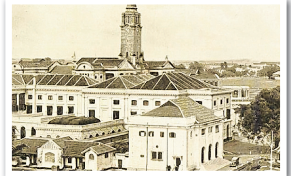
1989ல் ஆசிய அரும்பொருளகம்

தற்போதைய அரும்பொருளகம் 'எம்பிரஸ் பிளேஸ்' கட்டடத்தில் 2 மார்ச் 2003 முதல் செயல்பட்டு வருகிறது. அங்கு 11 காட்சிக் கூடங்களும் 1300 காட்சிப் பொருட்களும் இருக்கின்றன. இவை ஒவ்வொன்றும் ஆசிய வட்டாரத்திலுள்ள வெவ்வேறு நாகரிகத்தின் சாட்சிகளாக அமைந்துள்ளன.